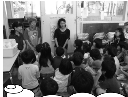
『おせっかい ばあちゃん』にお礼を 言っている時の様子。

子ども達からは、自然と 「とっても おいしかった」 「また つくってー」などと いった声が聞かれました！