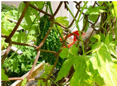
(園栽培のゴーヤー)