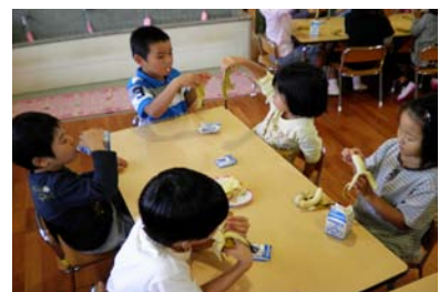
(園栽培のバナナをおやつに)