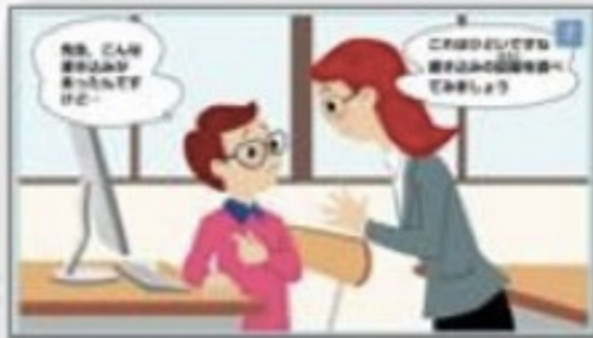
ネットで悪口が罪になる