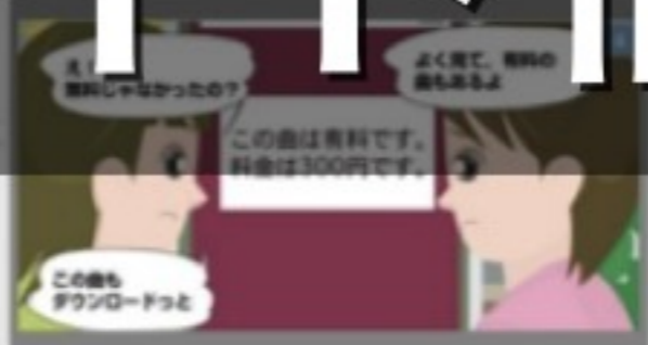
大人向けの情報に注意