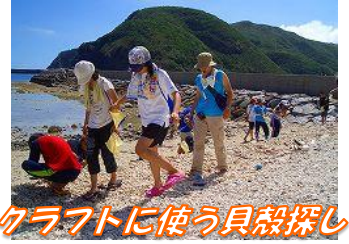
クラフトに使う貝殻探し