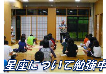
星座について勉強中