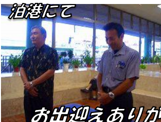
泊港にて お出迎えありがとうございました。