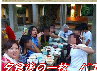
夕食後の一枚 パエリア美味しかった!