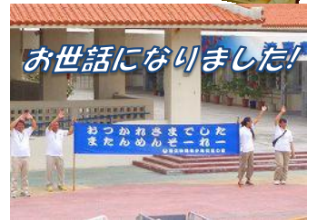
お世話になりました!