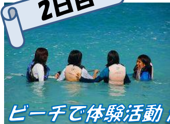
ビーチで体験活動 渡嘉敷の海を満喫♪