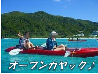
オープンカヤック♪