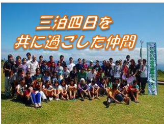
三泊四日を 共に過ごした仲間