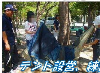
テント設営、練習通り出来るかな?