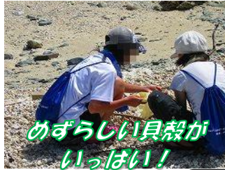
めずらしい貝殻が いっぱい!