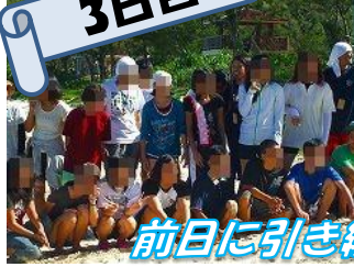
前日に引き続き海洋研修