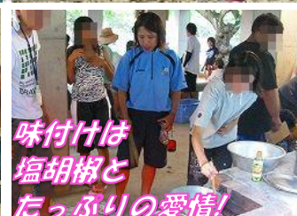
味付けは 塩胡椒と たっぷりの愛情!