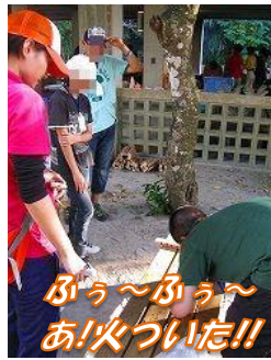
ぶら〜ぶら〜 あ!火ついた!!