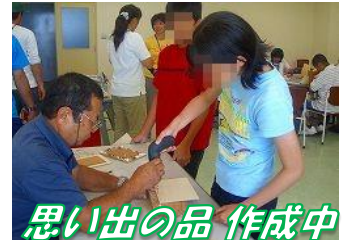
思い出の品 作成中